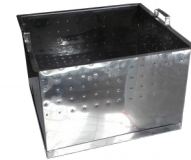
Kosz perforowany do stołu ABB (stal nierdzewna)

stal kwasoodporna perforowana grubość blachy: 0,6 mm wymiary kosza: 440X390X280 gwarancja: 2 lata