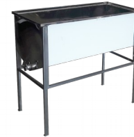
Wzmacniany stół do odsklepiania - 1m (Stal kwasoodporna/0,8mm)

stal nierdzewna (kwasoodporna) grubość blachy: 0,8 mm wymiary korpusu: 1020X500mm zawór: nierdzewny 6/4 nogi: malowane proszkowo zakres regulacji wysokości 620-980mm stół przystosowany do ramek o szerokości 435mm gwarancja: 2 lata