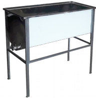
Wzmacniany stół do odsklepiania 1,5m (Stal kwasoodporna/0,8mm)

stal nierdzewna (kwasoodporna) grubość blachy: 0,8 mm wymiary korpusu: 1520X500mm zawór: nierdzewny 6/4 nogi: malowane proszkowo zakres regulacji wysokości 620-980mm stół przystosowany do ramek o szerokości 435mm gwarancja: 2 lata